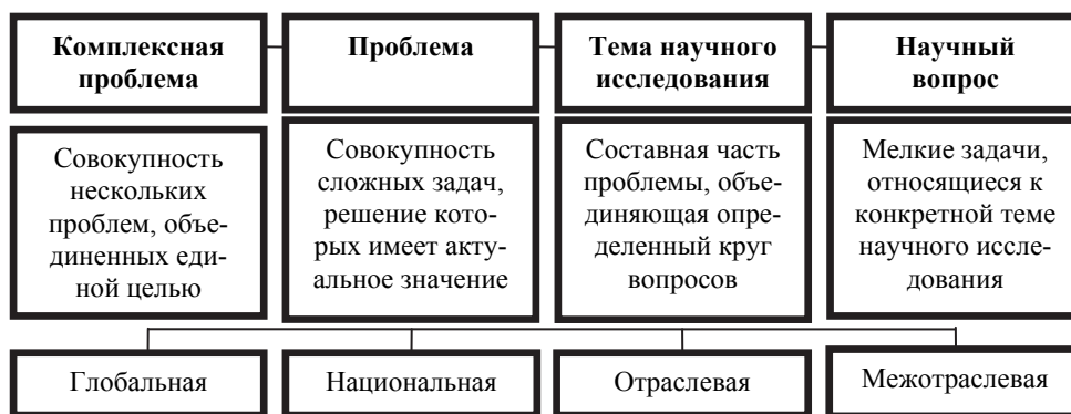
Рис. 2.2. Структурные единицы научного направления

Структурными единицами научного направления являются комплексные проблемы, темы и научные вопросы (рис. 2.2).